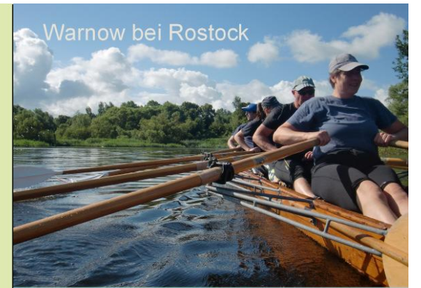
Warnow bei Rostock