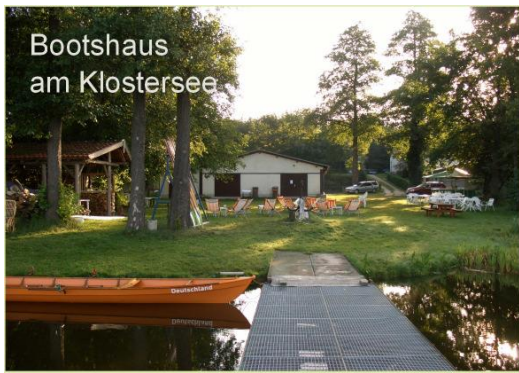
Bootshaus am Klostersee

Sektion Rudern Bootshaus Am Klostersee 14797 Kloster Lehnin